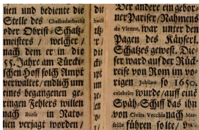
Abb. 2: Antiqua-Schrift in einem deutschen Text 219